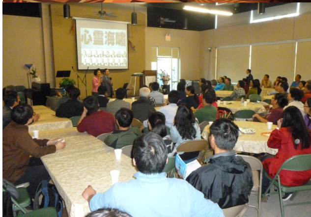
(右下) 4月13日光鹽社、曉士頓中國教會和the Rose 為24位低收入婦女做乳房攝影和營養諮詢。