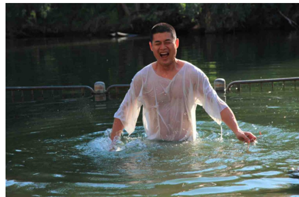
2010年2月6日在約旦河洗禮處亞得尼

2010年2月，我特意去了一趟以色列朝聖，因為我認識到：惟有我對神的信仰，才能夠給予我繼續活下去而且要活得更好的信心。在八天的旅程中，我拜訪了耶路撒冷、拿撒勒、加利利湖、伯利恆等地。在耶路撒冷哭牆下，我為我的健康進行了特別的禱告；在約旦河冰冷的河水裡我為自己實施了洗禮（因沒有任何牧師在場）！