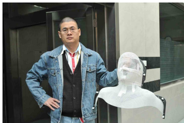
2008年12月18日在深圳市人民醫院接受第一次放射治療前