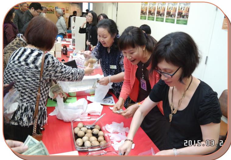
音乐会中场义卖，光盐社义工制作了茶叶蛋、蜜饯、泡菜、麻糬等各种美食。