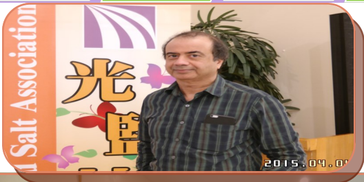
4月4日 光鹽社專題講「統對癌症的影響與作用」