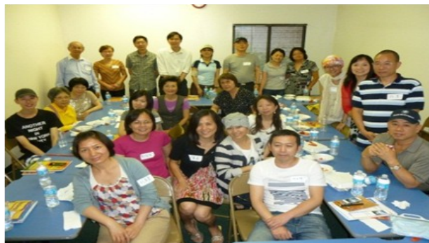
第一次光鹽社分享

藉著這個湖南家庭的到來，我們繼二連三接獲其他國際病友的需求、詢問，光鹽社團隊開始思考如何實際地協助這些遠到朋友，6月初，我們聚集這群病友們在光鹽社，召開第一次分享會，傾聽他們的困難，瞭解他們的需要，會中經由病友們的建議，我們