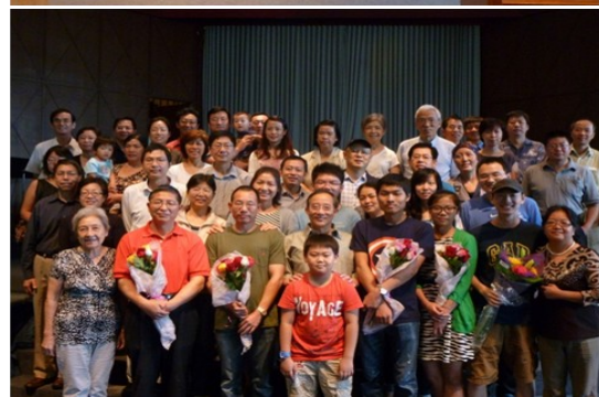
病人及家屬在曉士頓中國教會受浸歸主