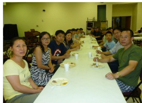
曉士頓中國教會團契聚餐

抗癌路是個艱辛的過程，安德森醫院雖然提供中文翻譯，但為緩解病人及家屬國外就診的緊張害怕情緒，我們經常陪伴參與他們的初診，幫忙他們安排住宿及處理醫院的費用問題，帶他們前往中國超市買菜，鼓勵他們參加光鹽社舉辦的健康講座。因為瞭解病人身、心、靈全面的需要，光鹽社也邀請曉士頓中國教會一同來關心病人及家屬，教會有許多弟兄姐妹到公寓探望，關心他們，傳福音給他們，並帶領十位病人及家屬信主，頓時，生命與愛的氣息就在這群朋友當中活躍起來。當我每次探訪他們，看到他們為做化療的病友加油、鼓勵，又帶來各家的愛心美食，彼此款待，雖然是在異國他鄉短期治病，他們中間卻蘊釀出如家人，戰友般的患難情誼，有歡笑，有淚水，有安慰的膀臂，有溫暖的擁抱。