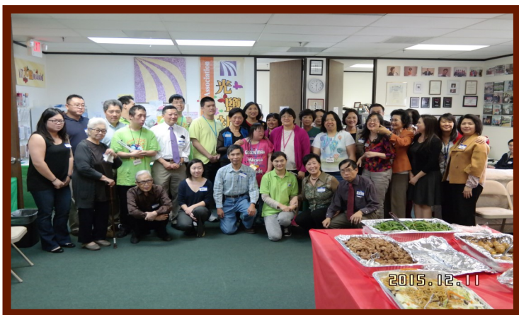
光盐社一年一度“开放日”