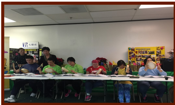
“光盐成长园地”的成年特殊儿在特殊需要关怀中心的圣诞聚会上表演节目