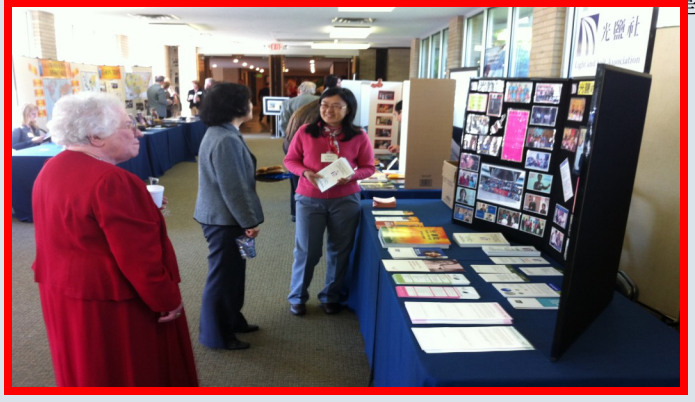
光鹽社在 Tallowood Baptist 教会 50 周年庆的社区外展活动中, 设立摊位, 介绍光鹽社事工, 分发健康宣导

← 年長關懷: 1 月 19 日年長關懷團隊一行近 15 人再次到 Westwood Rehabilitation Healthcare Center 探訪老人, Happy Dance Group 舞蹈隊表演精彩舞蹈。