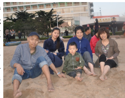
(答应卡卡的青岛之旅)

出院回到家后你就提出要带卡卡去青岛玩。我第一次和你发生争执，我认为现在的你应该在呆在家里休息。而你只说了一句，便噤住了我的千言万语，你说：事先答应过卡卡的，我一定要做到，我怕以后就没有机会了，我不想让卡卡记得我是个不遵守诺言的爸爸。三天后，我们启程前往青岛，这是我们全家的最后一次旅行。