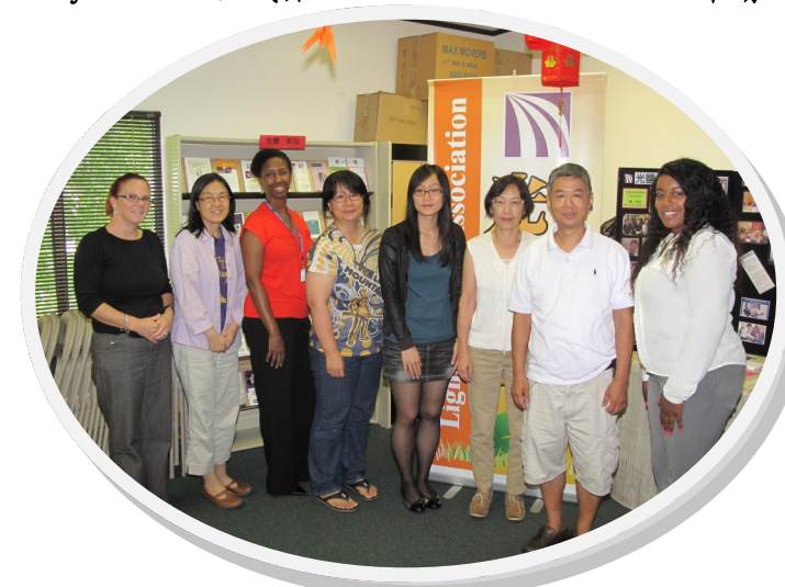
光鹽社義工與Gateway to Care成員合影