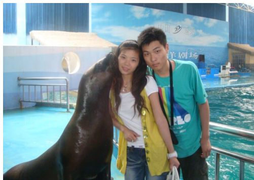
(2008.7 月 我们毕业旅行时的照片)