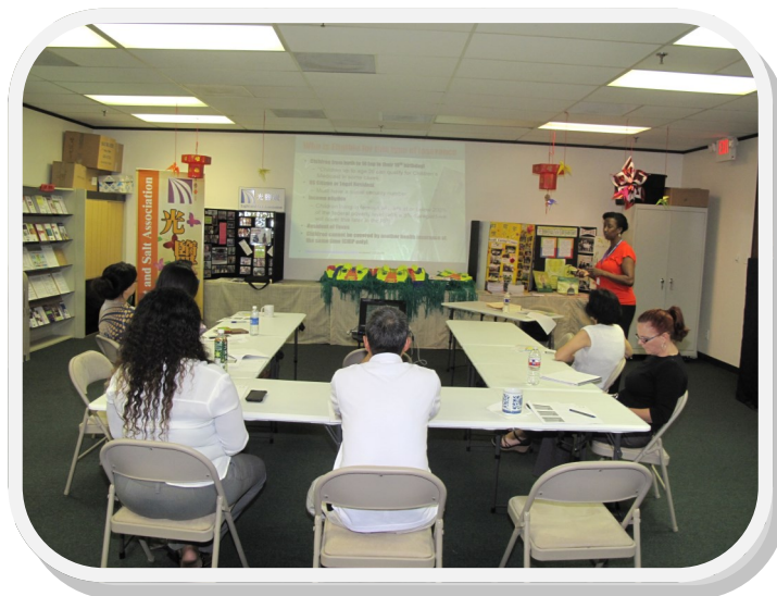
Gateway to Care組織介紹CHIP/Children Medicaid申請

看相片就知道我們有個快樂的快樂營！孩子們先拉拉筋再來一段"熱"舞，還真的會出汗耶！孩子們利用自己的想像力打扮出幾位驚艷的模特兒，可以媲美世界名模了吧！