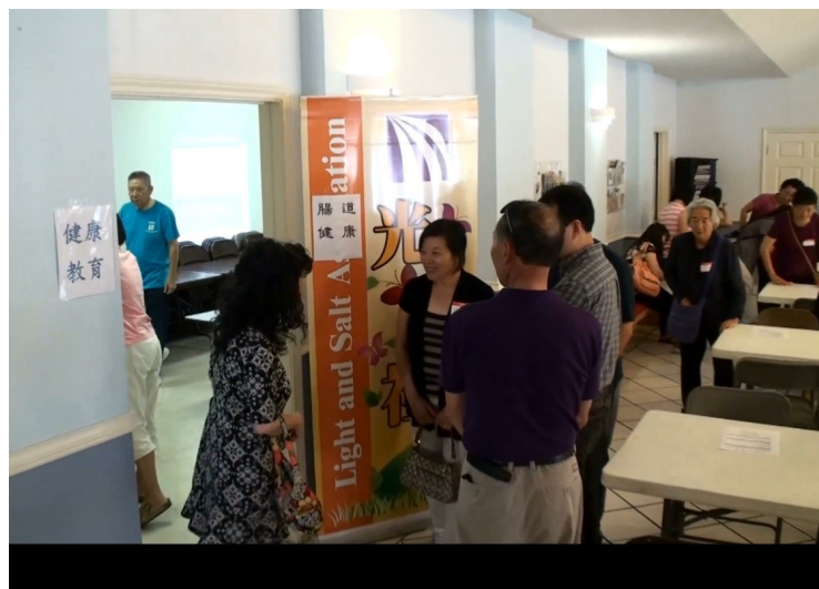
現場還向民眾提供了免費大便隱血篩檢FOBT