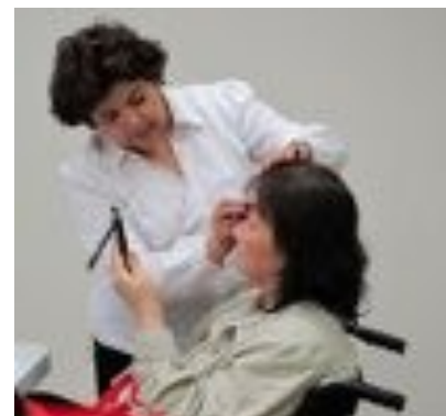
10月18日「容光煥髮班」，美國防癌協會的美容師為學員上課