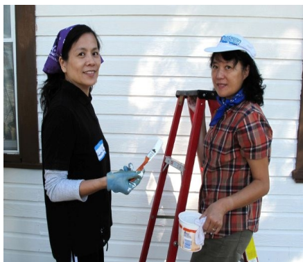
10月16日義工參與休士頓舊屋重建計劃

音樂會的票價為$20.、$50. 和 $100.，購票請電光鹽社辦公室713-988-4724。音樂會現場免費贈送光鹽社年刊並備有兒童看顧。希望您踴躍購票並撥冗出席音樂會。若您無法出席音樂會，願意以金錢支持光鹽社的服務項目，可以在支票上寫給：“Light & Salt Association”，並寄到9800 Town Park Dr., Suite 258B, Houston, TX 77036。光鹽社可提供捐款報稅收據。謝謝您的愛心和捐款。