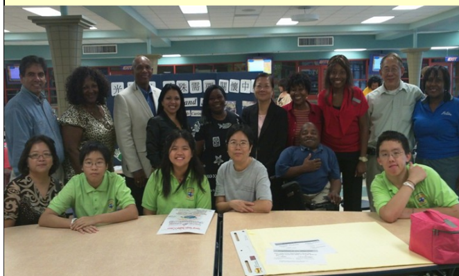
10月8日在Aldine High School舉辦的Barbara Jordan特殊需要外展介紹會

在 15 日的月會中，我們積極地為 10 月 29 日音樂會做排演練習，家長和孩子都很賣力喔！希望屆時能有很多人出席音樂會，對特殊需要群體能有進一步的認識，我們更盼望藉著孩子們的努力表現及家長們的見證分享能幫助更多特殊需要的家庭走出來。希望您預留時間來參加音樂會，時間：10/29 星期六，下午 4:00-6:00，地點：華人聖經教會 (6025 Sovereign Drive, Houston, TX 77036) 請來為我們的孩子加油打氣喲！