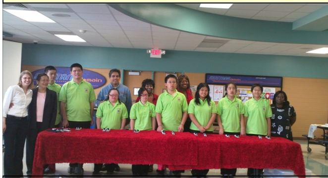
10/8 手鈴隊在外展介紹會中演奏拿手曲目