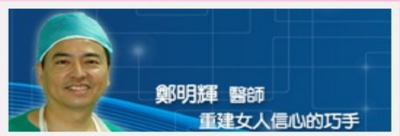
鄭明輝 醫師 重建女人信心的巧手