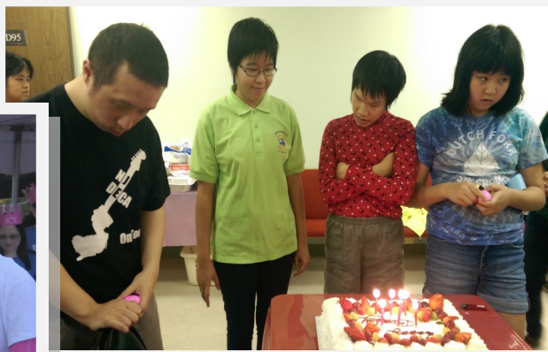
9月份特殊關懷中心月會慶生活動