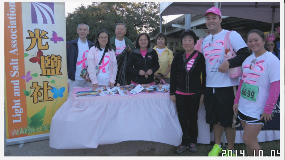
10/4 Komen競走活動，光鹽社每年都共襄盛舉，替乳癌防治盡一份心力