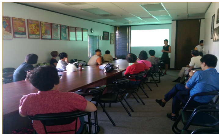
9月23號光鹽社特殊關懷中心同工和家庭拜訪德州農工大學教育心理系，Disability and Development 中心