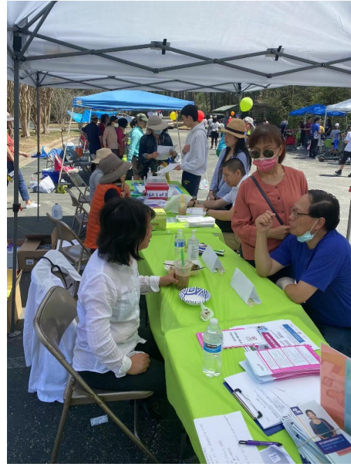
在2022年3月26日，光鹽社在休斯頓北區華人教會 NHCC主辦的春季園遊會活動中，設置攤位並向社區朋友推廣癌症篩檢的重要性及宣傳 All of Us 計劃。