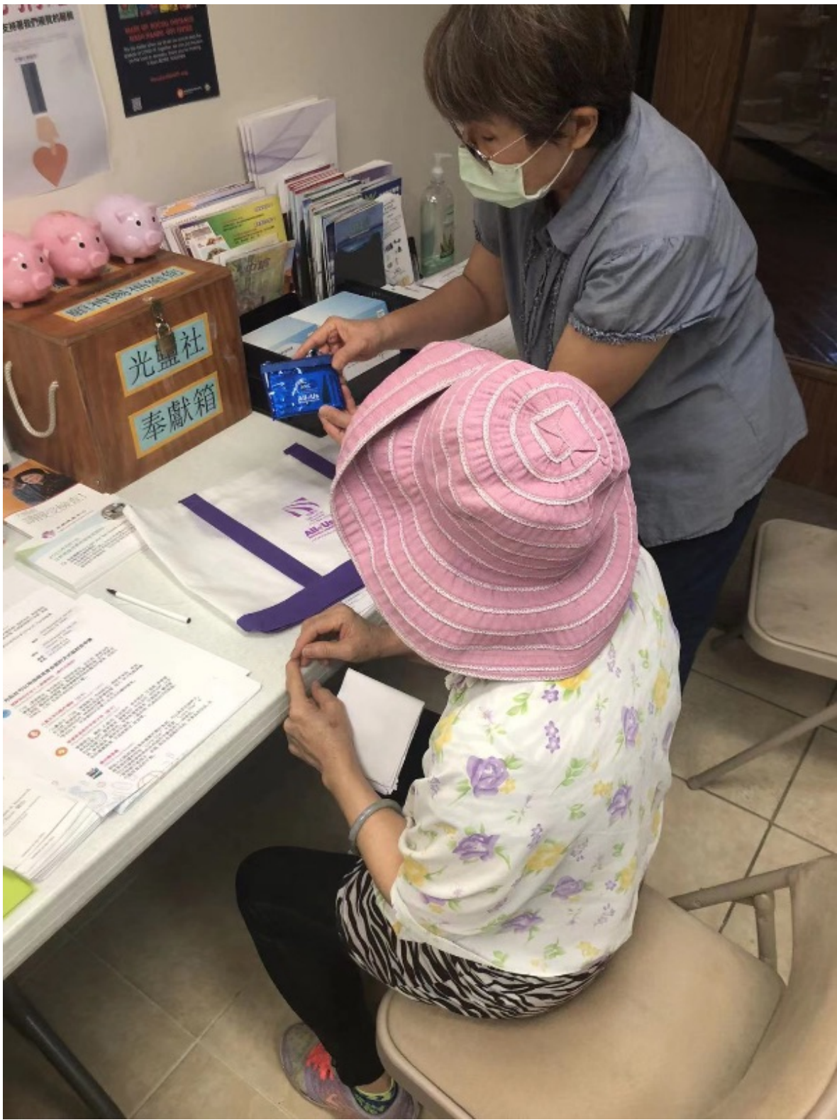
光鹽社向民眾介紹All of Us研究計劃。