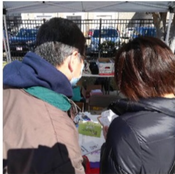
在2022年2月5日(正月初五)，光鹽社在中華文化服務中心主辦的新年園遊會活動中，設置攤位並向社區朋友推廣癌症篩檢的重要性及宣傳 All of Us 計劃。